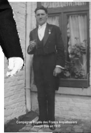
Compagnie Royale des Francs Arquebusiers Joseph Dâs en 1935