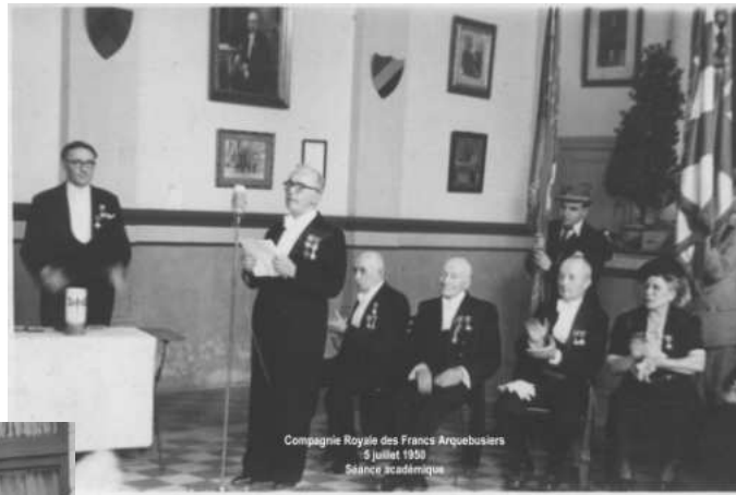
Compagnie Royale des Francs Arquebusiers 5 juillet 1950 Séance académique